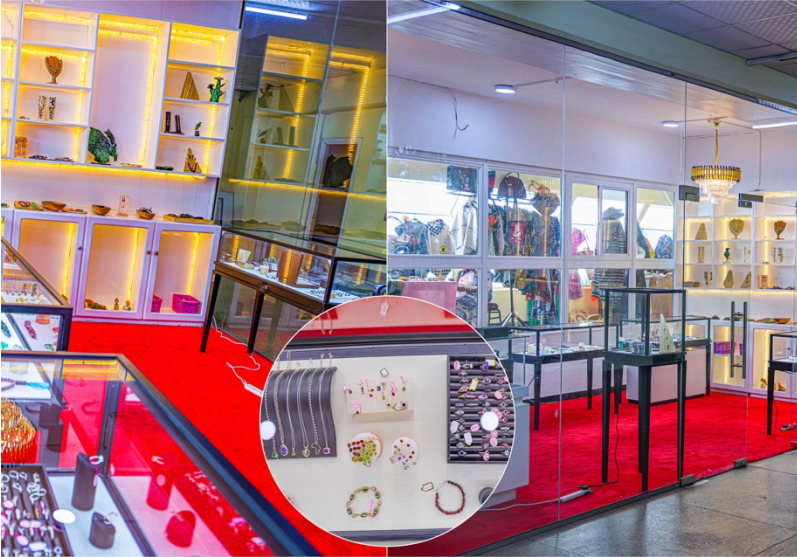
Picha Na. 10: Kituo cha mauzo na maonesho ya madini ya vito na bidhaa za usonara kilichopo katika Ukumbi wa Mkutano wa AICC.