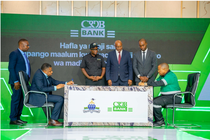
Picha Na. 5: Mheshimiwa Anthony P. Mavunde (Mb.), Waziri wa Madini akishuhudia utiaji saina wa makubaliano maalum ya kuwakopesha wachimbaji wadogo kati ya Tume ya Madini na Benki ya CRDB.

“Nitumie fursa hii kuzishukuru benki za CRDB, NMB, NBC, AZANIA na KCB kwa kuendelea kuwakopesha wachimbaji wadogo. Aidha, naomba kutoa wito kwa benki nyingine nchini kuendelea kuwaamini na kuwakopesha wachimbaji wadogo”