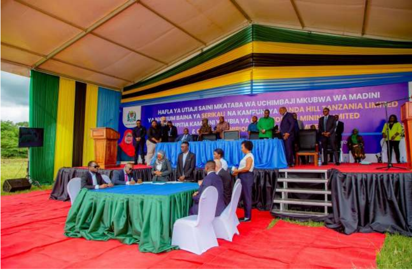
Picha Na. 2: Mheshimiwa Anthony P. Mavunde (Mb.), Waziri wa Madini akisaini kwa niaba ya Serikali mkataba wa uchimbaji mkubwa wa madini ya Niobium utakaomilikiwa kwa ubia baina ya Serikali na Kampuni ya Panda Hill Tanzania Limited.

26. Mheshimiwa Spika, katika kipindi cha Awamu ya Sita chini ya uongozi wa Mheshimiwa Dkt. Samia Suluhu Hassan , Rais wa Jamhuri ya Muungano wa Tanzania tumeshuhudia mageuzi makubwa na mafanikio ya hali ya juu katika Sekta ya Madini. Mchango wa sekta hii kwenye Pato la Taifa umeendelea kuimarika na kukua mwaka hadi mwaka ambapo mwaka 2023 mchango ulikuwa asilimia 9.1 na mwaka 2024 ulikuwa asilimia 10.1. Aidha, hadi kufikia kipindi cha robo tatu ya mwaka 2025 (Januari – Septemba) wastani wa mchango wa sekta umefikia asilimia 11.9.