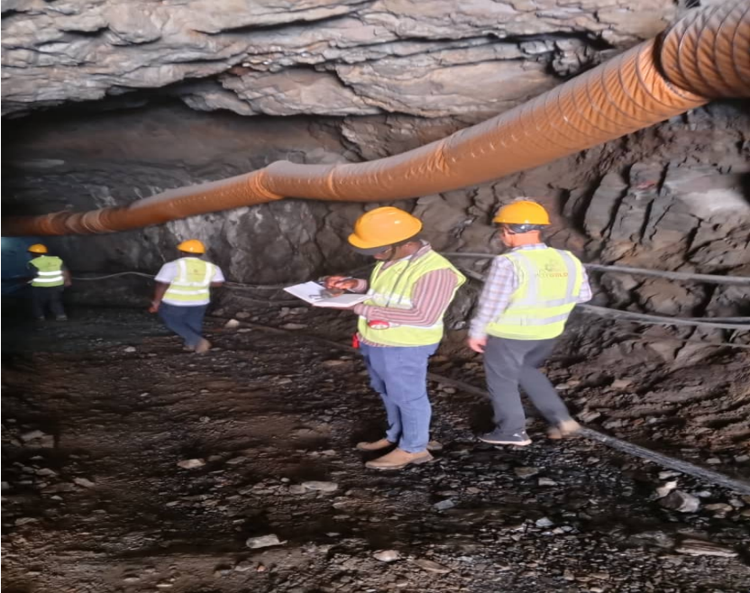
Picha Na. 7: Maafisa wakikagua masuala ya Usalama, Afya na Mazingira katika mgodi wa chini ya ardhi wa Polygold Co. LTD uliopo Musoma, Mara.

96. Mheshimiwa Spika, katika kipindi cha Julai 2025 hadi Machi 2026, ukaguzi ulifanyika katika maghala ya kuhifadhia baruti kwenye mikoa ya kimadini ya Kahama, Geita, Katavi, Kigoma, Manyara, Mirerani, Simiyu, Tanga, Mwanza, Mara, Tabora na Mbeya. Jumla ya maghala ya kuhifadhia baruti 678, bohari 145, Stoo 295 na masanduku 280 yalikaguliwa. Katika kaguzi hizo masuala mbalimbali yalibainika ikiwemo kukosekana kwa vipima joto ndani ya maghala, vinasia radi pamoja na uhifadhi wa baruti kuzidi