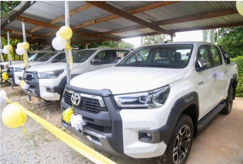
Picha Na. 6: Magari mapya manne (4) kwa ajili ya kuimarisha shughuli za utafiti GST.

73. Mheshimiwa Spika, Wizara imeendelea kuhakikisha kuwa Taasisi zilizo chini yake zinatekeleza majukumu yake kwa ufanisi na kuzipatia vitendea kazi. Tume ya Madini imewezeshwa vifaa vya masoko na TEHAMA; STAMICO imewezeshwa kupata leseni mbili za utafiti wa madini ya nikeli na adimu (REE); GST imewezeshwa upatikanaji wa vitendea kazi kwa ajili ya utafiti wa madini ikiwemo magari manne (4); TGC imewezeshwa kuboresha miundombinu ya kutolea mafunzo, huduma za uzalishaji wa bidhaa kwa lengo la kukuza shughuli za uongezaji thamani madini nchini; na TEITI imewezeshwa kwa kupewa jengo kwa ajili ya ofisi lililopo mji wa Serikali Mtumba.