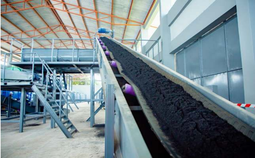
Picha Na. 8: Kiwanda cha kuzalisha Nishati Safi ya Rafiki Briquettes Mkoani Tabora ambacho kilizinduliwa tarehe 21 Februari, 2026.

Kiwanda cha Tabora kilizinduliwa tarehe 21 Februari, 2026. Aidha, Kiwanda cha Dodoma kinatarajiwa kuzinduliwa mwezi Mei, 2026.