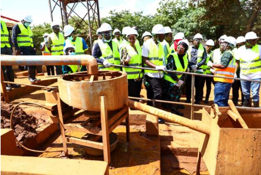
Picha Na. 1: Kamati ya Kudumu ya Bunge ya Nishati na Madini katika kutekeleza sehemu ya majukumu yake ikikagua mtambo wa uchenjuaji wa Madini ya Dhahabu katika Kituo cha Mfano cha Lwamgasa – Geita.

Makadirio ya Mapato na Matumizi ya Fungu 100, kwa Mwaka wa Fedha 2026/2027 na kuyapitisha kwa kauli moja.