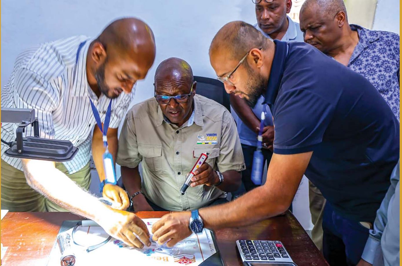
Mheshimiwa Dkt. Steven Kiruswa, Naibu Waziri wa Madini akitazama namna ya uthaminishaji madini ya spinel katika soko la madini Mahenge, Wilaya ya Ulanga Mkoani Morogoro.