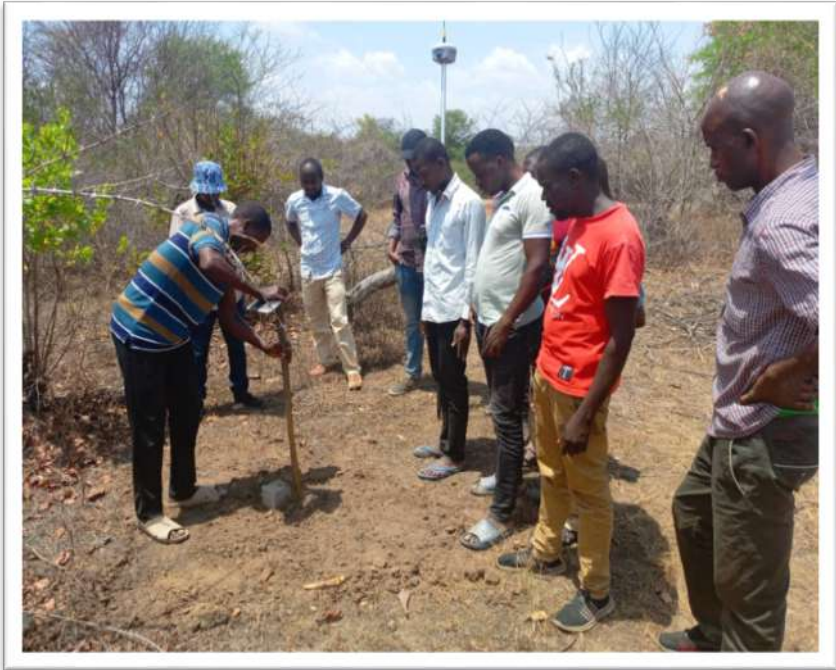
Wapima Ardhi wa Wizara wakishirikiana na wananchi katika zoezi la kupima mipaka ya vijiji katika halmashauri ya Ushetu Septemba, 2023.