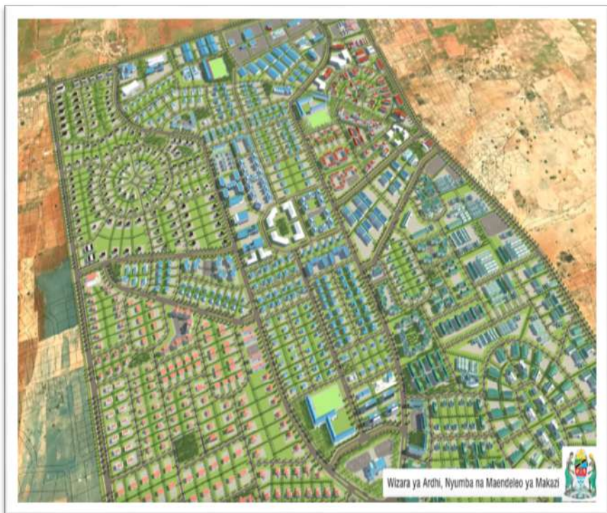
Muonekano wa Mradi wa Kupanga, Kupima na Kumilikisha Ardhi wa Msalato Satellite City jijini Dodoma

biashara za aina mbalimbali hivyo kupunguza msongamano wa wananchi wanaofuata mahitaji katikati ya mji. Katika mwaka 2024/25, Wizara imepanga kubuni na kusanifu miji ya Satelaiti miwili (2) katika majiji ya Dodoma (Msalato) na Arusha (AFCON City) ili kuwa na miji nadhifu na kudhibiti makazi holela. Aidha, Wizara itaendelea kusimamia kikamilifu matumizi ya fedha za mfuko ili kuwezesha halmashauri kupanga na kupima miradi iliyoandaliwa.