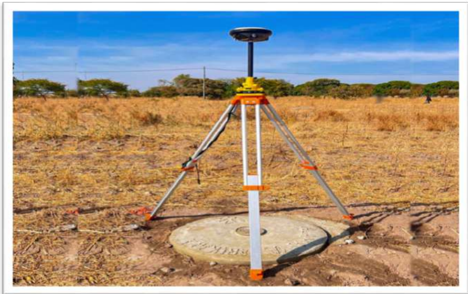
Alama za Msingi za upimaji wa ramani.

zaidi kwenye usimikaji wa Vituo vya Kielektroniki vya Upimaji ( Continuously Operating Reference Station- CORS ) ambavyo vitawezesha kazi za upimaji kufanyika kwa ufanisi zaidi.