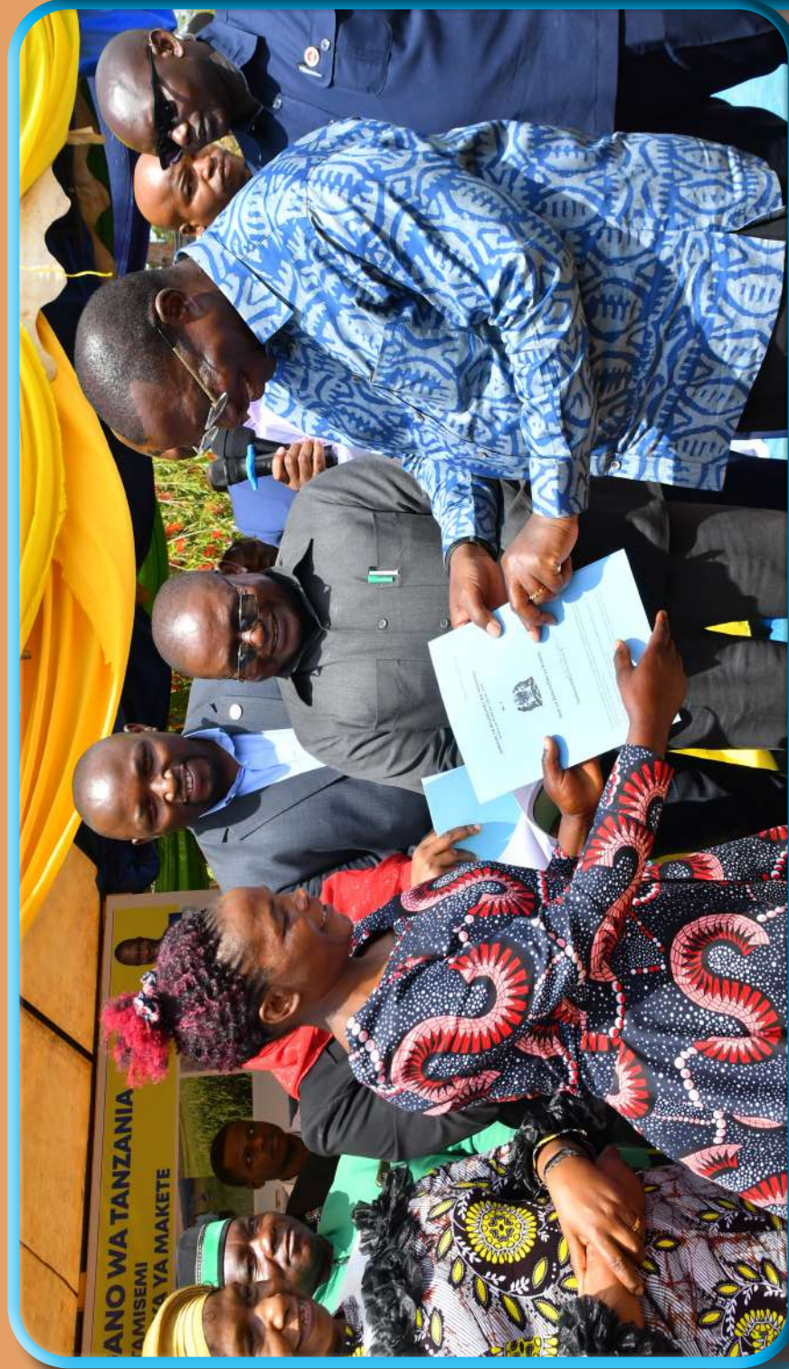
Makamu wa Rais wa Jamhuri ya Muungano wa Tanzania Mhe. Dkt Philip Isdori Mpango akikabidhi Hatimiliki za Kimila kwa mwananchi wa Makete mkoa wa Njombe tarehe 27 Oktoba 2023. Katikati ni Naibu Waziri wa Ardhi Nyumba na Maendeleo ya Makazi Mhe. Geofrey Mizengo Pinda (Mb.)