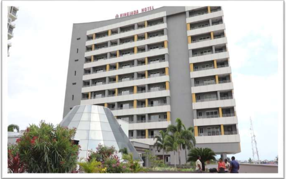
Hotel ya King Jada ni moja ya majengo ya Mradi wa Morocco Square jijini Dar es salaam