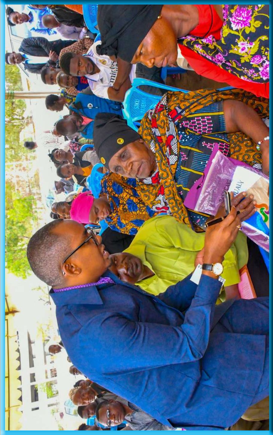
Waziri wa Ardhi Nyumba na Maendeleo ya Makazi Mhe. Jerry William Silaa (Mb.) akiwasilisha wananchi wakati wa Kliniki ya Ardhi tarehe 6 Novemba 2023 iliyofanyika jijini Dodoma.