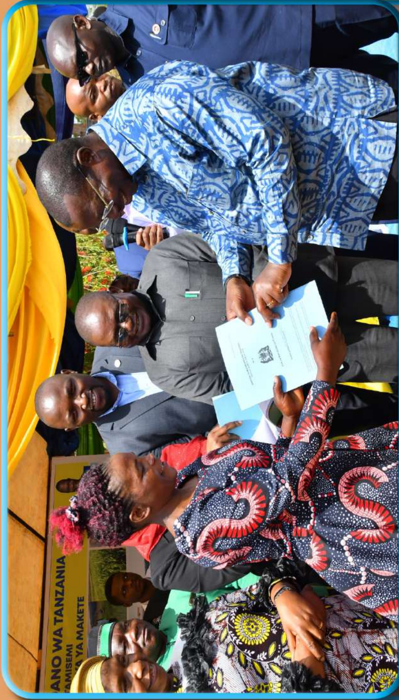
Makamu wa Rais wa Jamhuri ya Muungano wa Tanzania Mhe. Dkt Philip Isdori Mpango aikiabidhi Hatimiliki za Kimila kwa mwananchi wa Makete mkoa wa Njombe tarehe 27 Oktoba, 2023. Katikaiti ni Natibu Waziri wa Arathi Njumba na Maendeleo ya Makazi Mhe. Geofrey Mizengo Pinda (Mb.)