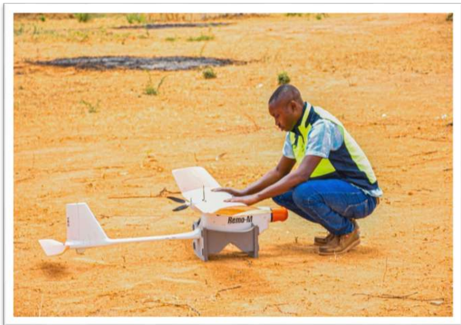
Mtaalamu wa kurusha Ndege isiyo na Rubani akijiandaa kurusha ndege.

katika matumizi ya teknolojia ya mifumo ya taarifa za kijiografia na kumbukumbu za ardhi. Aidha, Kituo hicho kitaongeza uwezo wa wataalamu wa ndani kutekeleza miradi ya ardhi na hivyo kuokoa matumizi ya fedha za kigeni zinazotumika kuajiri wataalam kutoka nje ya nchi. Hadi tarehe 15 Mei, 2024 wataalam 10 wamepata mafunzo ya ukufunzi nchini Tanzania na Korea Kusini.