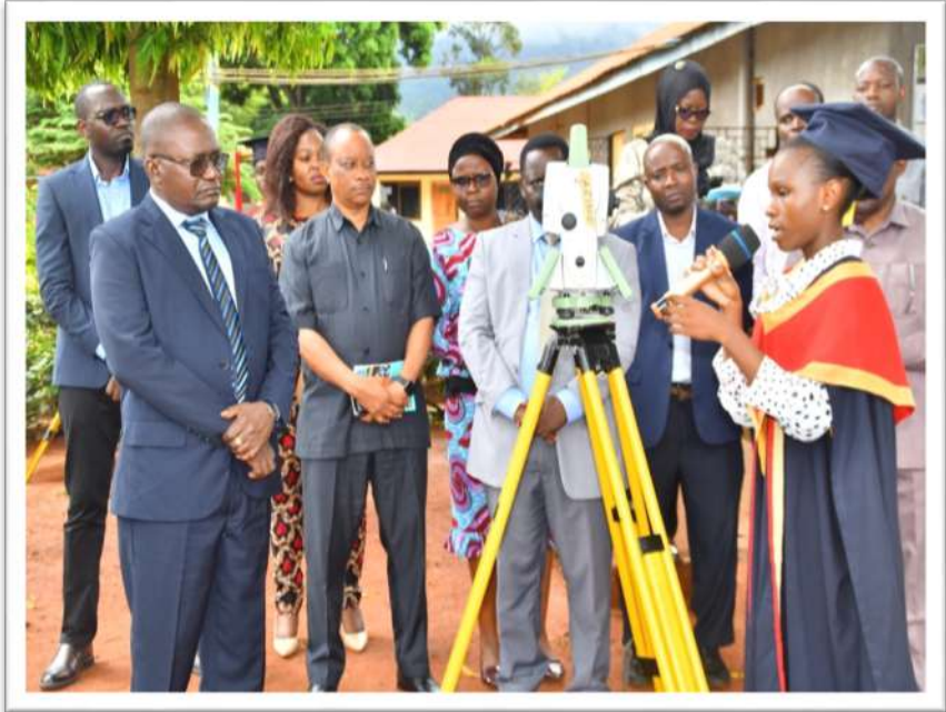
Naibu Waziri wa Ardhi Mhe. Geophrey Pinda (kushoto) akipata maelezo kutoka kwa mwanafunzi wa Chuo cha Ardhi Morogoro (ARIMO) wakati wa mahafali Novemba 2023