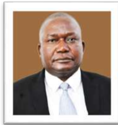
MHE. GEOPHREY MIZENGO PINDA (MB.) NAIBU WAZIRI